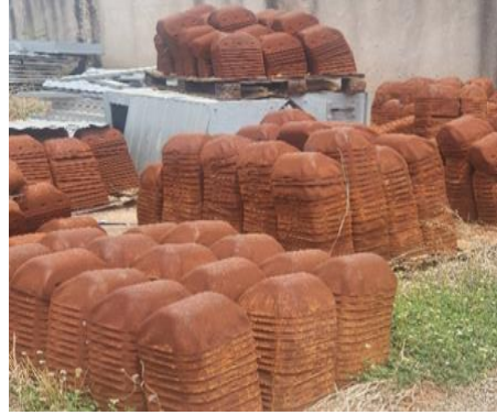
Picha iliyopigwa na wakaguzi tarehe 27 Oktoba 2023 katika eneo la ujenzi Shinyanga

Ninapendekeza NFRA ukamilishe vipande vitano (vya Songea, Dodoma, Mbozi, Shinyanga na Makambako) vilivyobaki ili kuepusha uchakavu zaidi wa vifaa vilivyotelekezwa katika eneo la ujenzi na kuepuka gharama ya kukodi maghala.