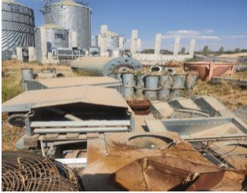
Picha iliyopigwa na wakaguzi tarehe 13 Oktoba 2023 katika eneo la ujenzi Dodoma