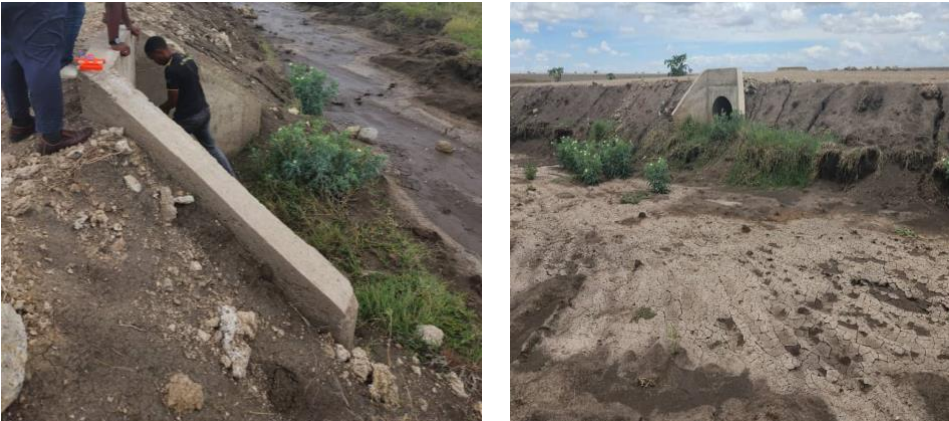
Chanzo: Wakaguzi walipotembelea eneo la mradi

Miradi ya barabara na madaraja iliyosimamiwa na TANROADS ilikumbana na matatizo. Mathalani, Daraja la Koga lenye urefu wa mita 120 lilikuwa na nyufa kutokana na kukosa mianya ya kupumulia. Aidha, kulikuwa na maji yaliyotuma kwenye mifereji ya Barabara ya Sikonge Spur, kiasi cha kuhatarisha afya.